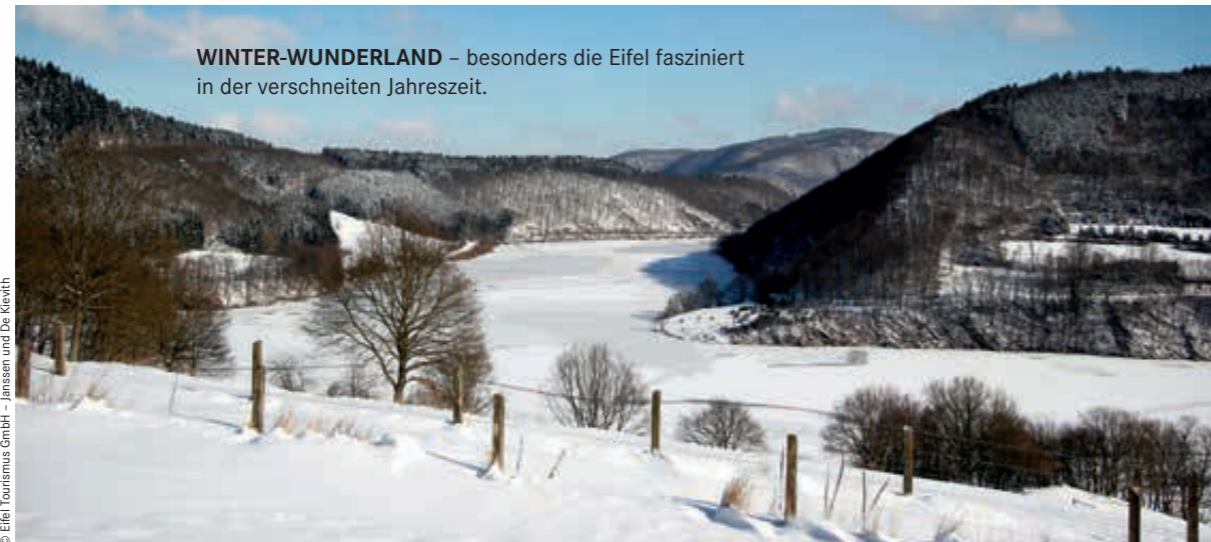
WINTER-WUNDERLAND – besonders die Eifel fasziniert in der verschneiten Jahreszeit.