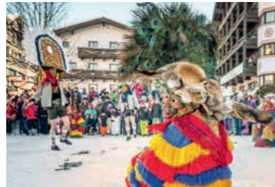
SEEFELD – traditionelle tirolerische Fastnacht.

In Seefeld hat die Sportlerlegende Toni Seelos in den 1930er-Jahren den Parallelschwung erfunden und damit ein neues Skizeitalter eingeläutet. Heute nennt sich