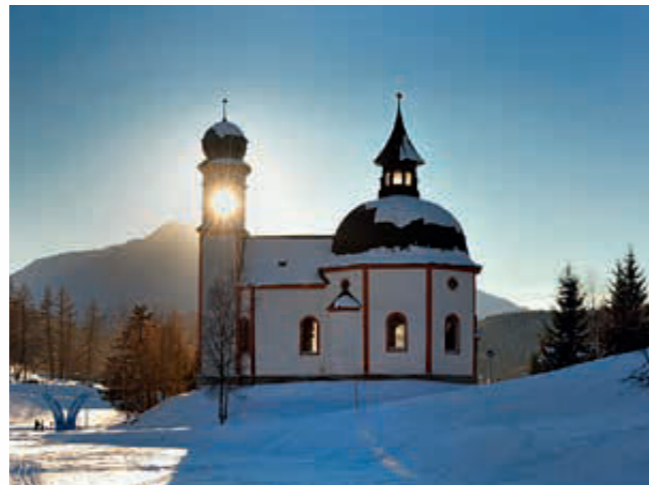
SEEKIRCHL: Das Wahrzeichens Seefelds – auch Heiligkreuzkirche genannt – wurde 1629 bis 1666 erbaut. Einst stand es mitten im künstlich angelegten Kreuzsee, der 1808 abgelassen wurde.

► nem 3.500 Quadratmeter großen Spa mit Außenbereich sind alle Gäste willkommen, die einfach mal abschalten, eine Massage genießen, einen Saunagang einlegen oder eine Runde schwimmen möchten.