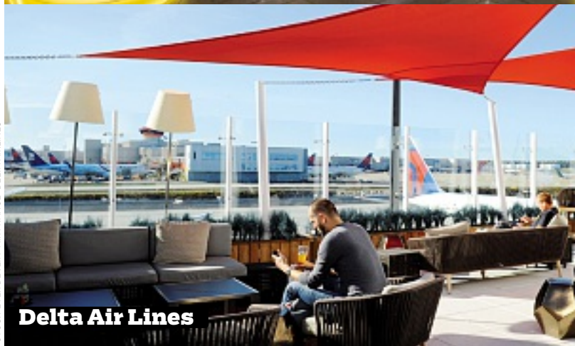
Delta Air Lines